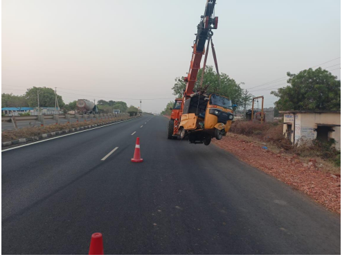
వెళ్ళి తిరుగు ప్రయాణంలో నంద్యాల నుండి రాత్రి 11 కు బయలు దేరి కర్నూలు కు వచ్చే సమయంలో ఓర్వకల్లు పోలీసుస్టేషన్ పరిధిలోని కాల్వబుగ్గ దగ్గర లోయలో ఆటో పడి ఈ సంఘటన జరిగింది. ఆటో దొంగలించారనేది నన్నూరు లోల్ గేట్ దగ్గర వెళ్ళి సినీ కెమెరాలను తనిఖీలు చేస్తే ఆటో నే వెళ్ళలేదని తెలిసింది.