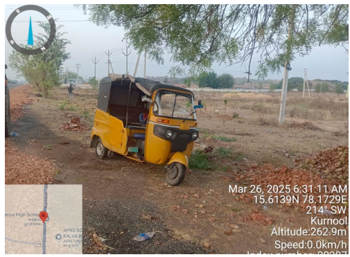
డ్రైవర్ కు బాగా గాయాలు అయ్యాయి .

కర్నూలు ప్రతినిధి మార్చి 26 (లపబ్లీక్ న్యూస్) నిన్న రాత్రి 1.45 నిమిషాలకు కర్నూలు కాల్వబుగ్గ - సోమాయాజుల వల్లె మధ్య నా ఆటో ను దోపిడి దోంగలు తీసుకెళ్ళారని కమాండ్ కంట్రోల్ కి ఒక వ్యక్తి కాల్ చేసి సమాచారం ఈ క్రింది విధంగా ఇచ్చారు.నంద్యాల నుండి కర్నూలు వైపు వెళ్తుంటే ఇద్దరు వ్యక్తులు నా ఆటోను ఆపి, నా పై దాడి చేసి గాయపరిచి , నా ఆటో ఎత్తుకెళ్ళారని కాల్వబుగ్గ సమీపంలో 2 కిలోమీటర్ల దూరంలో ఉన్న నయారా వెట్రోల్ బంక్ లో కి వచ్చి కర్నూలు పోలీసులకు ఫోన్ చేసి సమాచారం అందించడంతో కర్నూలు కమాండ్ కంట్రోల్ నుండి కర్నూలు పోలీసులు అప్రమత్తం అయ్యారు. జిల్లా ఎస్పీ విక్రాంత్ పాటిల్ ఐపియన్ ఆదేశాల మేరకు కర్నూలు డిఎస్పీ జె. బాబు ప్రసాద్ ఆధ్వర్యంలో కర్నూలు సబ్ డివిజన్ పోలీసులను అప్రమత్తం చేశారు. చెక్ పోస్టులు, కర్నూలు సరిహద్దు ప్రాంతాలలో అర్ధరాత్రి తనిఖీలు నిర్వహించారు. కర్నూలు డిఎస్పీ జె. బాబు ప్రసాద్ ఓర్వకల్లు కు అర్ధరాత్రి వెళ్ళి చూడడం జరిగింది. కాల్వబుగ్గ దగ్గరకు వెళ్ళి సంఘటన జరిగిన ప్రాంతానికి వెళ్ళి చూస్తే ఆటో లోయలో పడింది. ఆటో