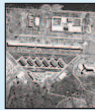
అణు రియాక్టర్, అప్పర