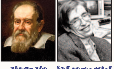
గెలిలియో గెలిలి స్టీఫెన్ విలియం హాకింగ్