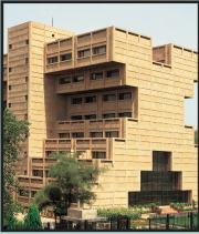
జాతీయ సైన్య అకాడమీ