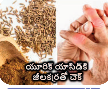
యూరిక్ యాసిడ్ కి జీలకర్రతో చెక్

చాలామందిని ఎఫెక్ట్ చేసే సమస్యలో యూరిక్ యాసిడ్ కూడా ఒకటి. ఈ సమస్య చాలా ఇబ్బంది పెడుతుంది. చలికాలంలో మరింత దారుణంగా మారుతుంది. మనం తీసుకునే ఫుడ్స్ లోని ప్యూరిన్స్ విచ్చిన్నమైనప్పుడు శరీరంలో యూరిక్ యాసిడ్ ఏర్పడుతుంది. ఈ యూరిక్ యాసిడ్ మూత్రం ద్వారా బయటికి వెళ్తుంది. కానీ, కొన్నిసార్లు ఇది బాడీలో ఎక్కువగా అయినప్పుడు అనేక సమస్యలొస్తాయి. అందుకే, ఈ సమస్యని తగ్గించుకునేందుకు చాలా మంది అనేక ప్రయత్నాలు చేస్తారు. ఇంటి చిట్టాలు కూడా ఈ సమస్యకి బాగానే పనిచేస్తాయి. ఇందులో జీలకర్రతో చేసిన (డింక్స్) కూడా సమస్యని తగ్గిస్తాయి. అదెలానో తెలుసుకోండి.