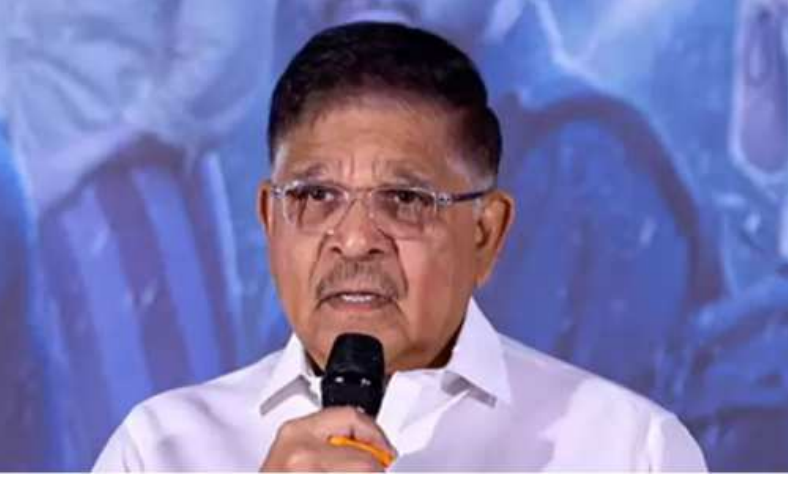
హైదరాబాద్, డిసెంబర్ 18, (ఠపల్లిక్ న్యూస్):