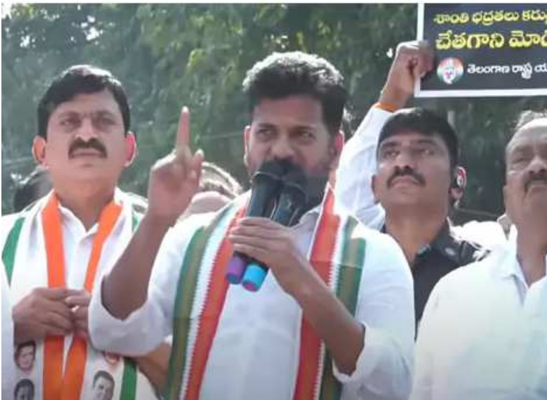
హైదరాబాద్, డిసెంబర్ 18, (ఠపల్లిక్ న్యూస్):

తెలంగాణ సీఎం రేవంత్ రెడ్డి విమర్శించారు.