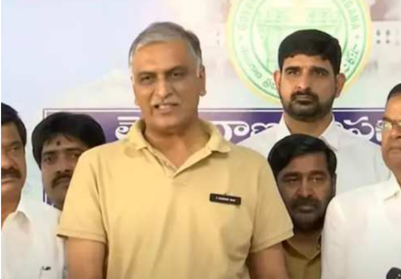
హైదరాబాద్, డిసెంబర్ 18, (ఠపల్లిక్ న్యూస్):

ధర్మా పేరుతో రోడ్లపై సర్కస్ ఘీట్లు చేస్తున్న సీఎంరేవంత్ రెడ్డి డైరెక్షన్ పాలిటిక్సు సు ప్రజలు గమనిస్తున్నారని మాజీ మంత్రి, భారాస ఎమ్మెల్యే హరిశ్ రావు అన్నారు.