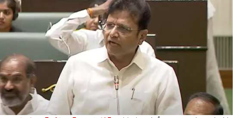
హైదరాబాద్, డిసెంబర్ 18, (ఠపల్లిక్ న్యూస్):