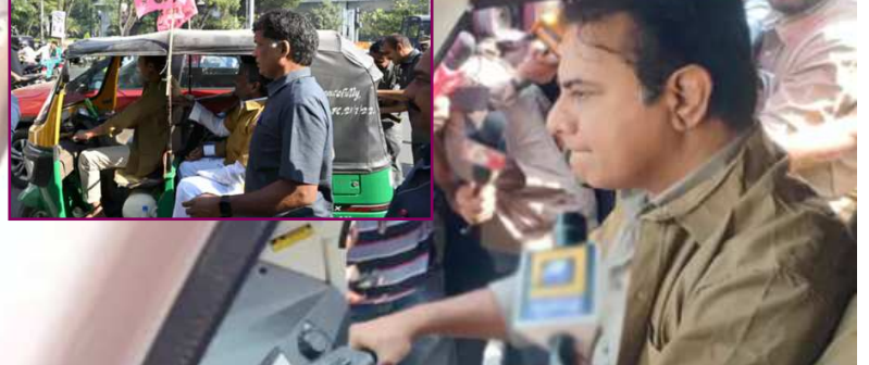
హైదరాబాద్, డిసెంబర్ 18, (ఠపల్లిక్ న్యూస్):

భారాస ఎమ్మెల్యేలు, ఎమ్మెల్సీలు ఆటోలో అసెంబ్లీకి వచ్చారు. పార్టీ కార్యనిర్వాహక అధ్యక్షుడు కేటీఆర్ కొందరు ఎమ్మెల్యేలను ఎక్కించుకుని స్వయంగా తానే ఆటో నడుపుతూ అసెంబ్లీకి చేరుకున్నారు. పార్టీ నేతలంతా ఖాకీ చొక్కాలు ధరించి వచ్చారు.