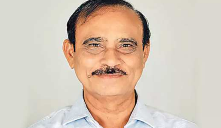
గుంటూరు, డిసెంబర్ 18, (ఠపల్లిక్ న్యూస్):