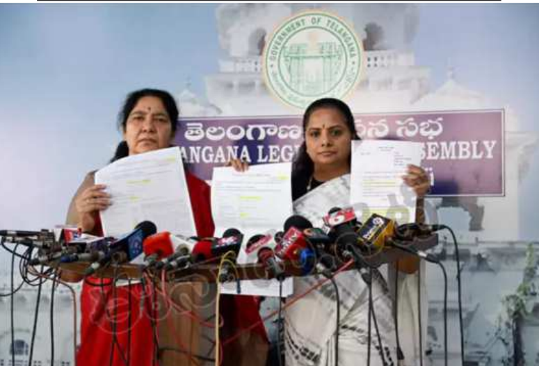
హైదరాబాద్, డిసెంబర్ 18, (ఠపల్లిక్ న్యూస్):

భారాస సభ్యులు మండలిలో అడిగిన ప్రశ్నలకు ప్రభుత్వం తప్పుడు సమాధానాలు ఇస్తోందని ఎమ్మెల్సీ కవిత సత్యవతి రాథోడ్ ఆరోపించారు.