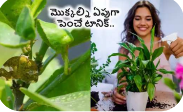
మొక్కల్ని ఏప్పుగా పెంచేటానికే..

ఈ రోజుల్లో చాలా మంది గార్డెనింగ్ ఇష్టపడుతున్నారు. చిన్న స్థలం ఉన్నా సరే అక్కడ మొక్కల్ని పెంచుతున్నారు. నగరాల్లో నివసించే ప్రజలు కుండీల్లో మొక్కల్ని నాటుతున్నారు. గ్రామాల్లో ఉన్న ప్రజలు తమ పెరట్లో కూరగాయలు, పూల మొక్కలతో పాటు కొన్ని ఔషధపు మొక్కల్ని పెంచుతున్నారు. ఇక, సాధారణంగా గార్డెన్ లో పూలు, పండ్లతో పాటు ఇతర గార్డెనింగ్ మొక్కల్ని పెంచుతుంటారు. మన పెరడు లేదా బాల్కనీలో కొన్ని రకాల మొక్కలను పెంచడం ద్వారా శారీరక, మానసిక, ఆరోగ్యపరమైన లాభాల్ని పొందవచ్చు. అయితే, మొక్కలు పెంచాలి అన్న ఆలోచన ఉండే సరిపోదు.. వాటిని పెంచడం కూడా తెలిసి ఉండాలి. ఇక, చాలా మంది ఇంట్లో మొక్కలు బాగా పెంచినా కీటకాలు, పీడతో ఇబ్బంది పడతాయి. అయితే, వీటిని తరిమికొట్టడానికి రకరకాల రసాయనాలు వాడతారు. ఈ రసాయనాలతో నేల సారం దిబ్బితినడమే కాకుండా.. మొక్కలు కూడా నాశనమయ్యే ప్రమాదముంది. రసాయనాలకు బదులు ఇంట్లో దొరికే వాటితో మొక్కల కోసం టానిక్ తయారు చేయవచ్చు. ఈ టానిక్ తో కీటకాలు పారిపోవడమే కాకుండా మొక్కలు ఏప్పుగా పెరుగుతాయి. ఇది ఎలా చేసుకోవాలి ఇక్కడ తెలుసుకుందాం.