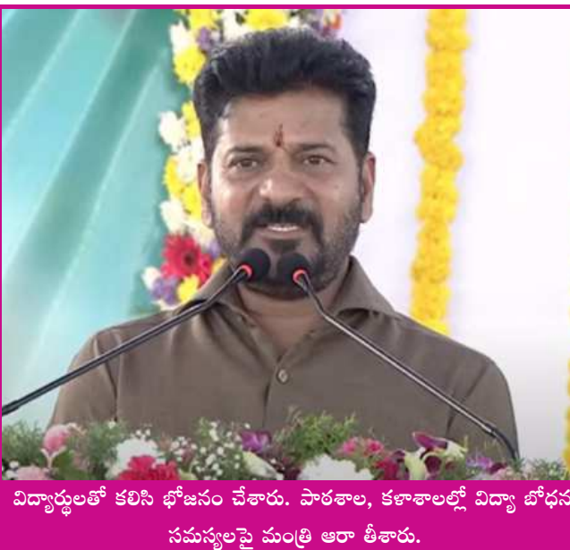
విద్యార్థులతో కలిసి భోజనం చేశారు. పాఠశాల, కళాశాలల్లో విద్యార్థులతో కలిసి భోజనం చేశారు. పాఠశాల, కళాశాలల్లో విద్యార్థులతో కలిసి భోజనం చేశారు. సమస్యలపై మంత్రి ఆరా తీశారు.

చిలుకూరు, డిసెంబర్ 14, (రెపబ్లిక్ న్యూస్): రంగారెడ్డి జిల్లా చిలుకూరులో గురుకుల పాఠశాలను సీఎం రేవంత్ రెడ్డి సందర్శించారు. గురుకులాలూ, సంక్షేమ హాస్పిటల్లో కామన్ డైట్ను ప్రారంభించారు. బీసీ, ఎస్సీ, ఎస్టీ, మైనారిటీ గురుకులాలూ, హాస్పిటల్లో ఒకే విధమైన మెనూ అమలు చేస్తున్నారు. పెంచిన డైట్ ఛార్జీలకు అనుగుణంగా రాష్ట్ర ప్రభుత్వం కొత్త మెనూ రూపొందించింది. గురుకులాల బాటలో భాగంగా రాష్ట్రవ్యాప్తంగా మంత్రులు గురుకులాలను సందర్శించారు. ఖమ్మం జిల్లా ఖోసకల్ పాఠశాలలో కామన్ డైట్ మెనూను ఉప ముఖ్యమంత్రి భట్టి విక్రమార్కు ప్రారంభించారు. పేకేట్రు గురుకుల పాఠశాలను మంత్రి పొన్నం ప్రభాకర్ (సందర్శించారు. తరగతి గదిలో డిజిటల్ బోర్డు పనితీరును పరిశీలించారు. సికింద్రాబాద్ మహేంద్రపూర్లో గురుకుల పాఠశాలను మంత్రి ఉత్తమ్ముమూర్ రెడ్డి పరిశీలించారు.