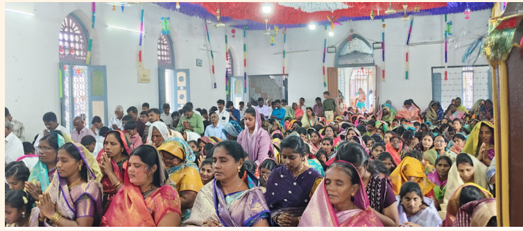
క్రీస్టన్ ప్రత్యేక ప్రార్థనలో పాల్గొన్న క్రీస్టియన్ సోదరి సోదరులు