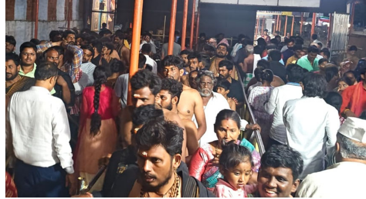
మహానంది,డిసెంబర్ 21,( రిపబ్లిక్ స్టూన్):-

మహానంది ఆలయంలో శనివారం వీకెండ్ పురస్కరించుకుని రాతి వరకు భక్తుల రద్దీ కొనసాగింది. ఈ మేరకు పలు ప్రాంతాలకు చెందిన వేలాది మంది భక్తులు ఆలయానికి చేరుకొని సాధారణ, శీఘ్ర, అతి శీఘ్ర దర్శనం క్యూలైన్ల ద్వారా గంటల తరబడి వేచి ఉండి శ్రీ కామేశ్వరి దేవి సహిత శ్రీ మహానందిశ్వర స్వామివారిని దర్శించుకున్నారు. హారతుల సమయంలో ఆర్జిత సేవల కోసం భక్తులు వేచి ఉండడంతో క్యూ లైన్లు నిండిపోయాయి.