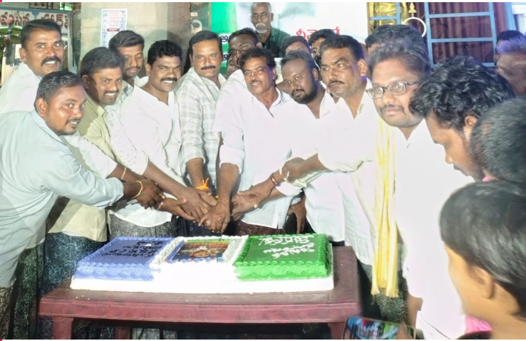
బండి ఆత్మకూరు, డిసెంబర్ 21, ( రిపబ్లిక్ స్టూన్):-