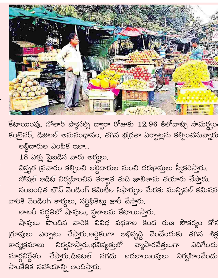
కేటాయింపు, సోలార్ ప్యానెల్స్ ద్వారా రోజుకు 12.96 కిలోవాట్స్ సామర్థ్యంతో కంట్రైన్, డిజిటల్ అనుసంధానం, తగిన భద్రతా ఏర్పాట్లను కల్పించనున్నారు. లబ్ధిదారుల ఎంపిక ఇలా.. 18 ఏళ్లు పైబడిన వారు అర్హులు. విప్లవ ప్రచారం కల్పించి లబ్ధిదారుల నుంచి దరఖాస్తులు స్వీకరిస్తారు. సోషల్ ఆడిట్ నిర్వహించిన తర్వాత తుది జాబితాను తయారు చేస్తారు. సంబంధిత టౌన్ వెండింగ్ కమిటీల నిఫార్సుల మేరకు మున్సిపల్ కమిషనర్లు వారికి వెండింగ్ కార్డులు, సర్టిఫికెట్లు జారీ చేస్తారు. లాటరీ పద్ధతిలో షాపులు, స్థలాలను కేటాయిస్తారు. షాపులు పొందిన వారికి వివిధ పథకాల కింద రుణ సౌకర్యం కోసం గ్రూపులు ఏర్పాటు చేస్తారు.ఆర్థికంగా అభివృద్ధి చెందేందుకు తగిన శిక్షణ కార్యక్రమాలు నిర్వహిస్తారు.భవిష్యత్తులో వ్యాపారవేత్తలుగా ఎదిగేందుకు మార్కెటింగ్ చేస్తారు.డిజిటల్ నగదు బదలాయింపులు నిర్వహించేందుకు సాంకేతిక సహాయాన్ని అందిస్తారు.

స్ట్రాట్ స్ట్రీట్ వెండింగ్ మార్కెట్లకు శ్రీకారం స్థిరమైన, ఆకర్షణీయమైన స్థలాల్లో వ్యాపారం నెలకూర్చు మైపాడు రోడ్డులో పైలట్ ప్రాజెక్టు ఉత్తర్వులు జారీ చేసిన ప్రభుత్వం అమరావతి, డిసెంబరు 20: వీధి వ్యాపారుల జీవనోపాధిని మెరుగుపరచడానికి రాష్ట్ర ప్రభుత్వం వినూత్న కార్యక్రమానికి శ్రీకారం చుట్టింది. వీధి వ్యాపారుల కోసం పట్టణాలు, నగరాల్లో స్థిరమైన, ఆకర్షణీయమైన స్థలాలను కేటాయించి వాటిలో 'స్ట్రాట్ స్ట్రీట్ మార్కెట్ల'ను ఏర్పాటు చేస్తోంది. వీధుల్లో రద్దీని తగ్గించడం, వీధి వ్యాపారుల జీవనోపాధిని మెరుగుపరచడం, వారికి స్థిరమైన మార్కెటింగ్ సౌకర్యాలను కల్పించే లక్ష్యంతో ఈ ప్రాజెక్టును ప్రారంభించాలని, స్వయం సహాయక సంఘాలలోని కుటుంబాలను కూడా ప్రోత్సహించాలని ప్రభుత్వం నిర్ణయించింది. మెప్పా ఆధ్వర్యంలో పైలట్ ప్రాజెక్టు కింద నెలకూర్చు నగరంలోని మైపాడు రోడ్డులో 200 షాపులతో స్ట్రాట్ స్ట్రీట్ వెండింగ్ మార్కెట్ ఏర్పాటుకు అనుమతిస్తూ రాష్ట్ర ప్రభుత్వం శుక్రవారం ఉత్తర్వులు జారీచేసింది. కంట్రైన్ మోడల్లో ఏర్పాటు చేయనున్న ఈ స్ట్రాట్ స్ట్రీట్ వెండింగ్ మార్కెట్లకు రూ.7 నుంచి రూ.9కోట్ల వరకు ఖర్చవుతుందని అంచనా వేశారు. ఇక్కడ విజయవంతమైతే రాష్ట్రంలోని ఇతర నగరాలు, పట్టణాల్లో మున్సిపల్ కమిషనర్ల ఆధ్వర్యంలో ఆ మార్కెట్లను ఏర్పాటు చేయనున్నారు. వీధి వ్యాపారుల సర్వీ, గుర్తింపు కార్డుల జారీ, వ్యాపార ప్రణాళిక తయారీ, వ్యాపార జోన్ ఏర్పాటు, నెలవారీ కార్యకలాపాలను మెప్పా సమీక్షిస్తుంది. స్ట్రాట్ స్ట్రీట్ మార్కెట్లలో వ్యాపారులకు అనుకూలమైన రూఫ్ టాప్, స్థలం