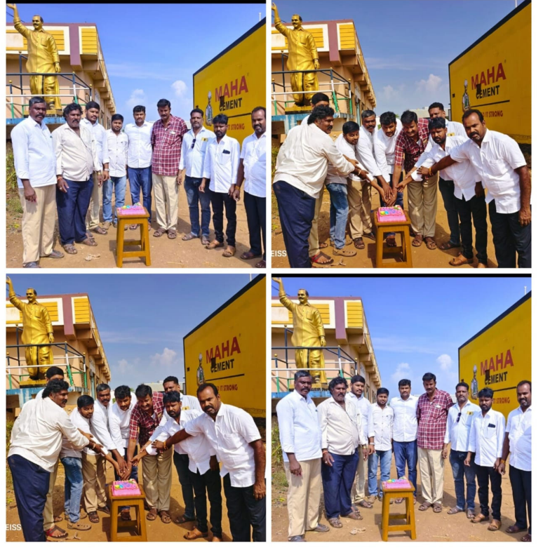
పోరాటం చేయాలని పిలుపునిచ్చారు. ఈ కార్యక్రమంలో వైఎస్ఆర్ఎస్ నాయకులు, కార్యకర్తలు, తదితరులు పాల్గొన్నారు.