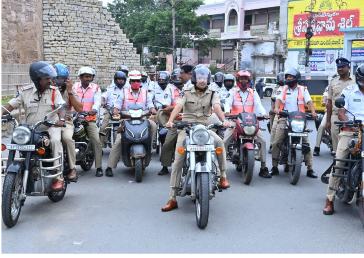
-ద్విచక్ర వాహనం నడిపే ప్రతిఒక్కరూ హెల్మెట్ తప్పనిసరిగా ధరించాలి. -హెల్మెట్ ధరించడం పై ప్రజలకు అవగాహన కల్పించేందుకే ఈ కార్యక్రమం.