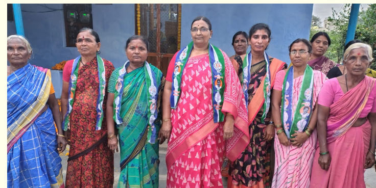
బండి ఆత్మకూరు, డిసెంబర్ 20, ( రిపబ్లిక్ న్యూస్)