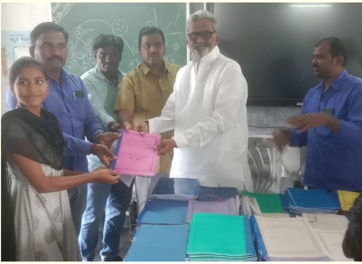
వెలుగోడు డిసెంబర్ 20 (రిపబ్లిక్ న్యూస్) :