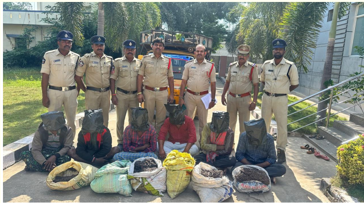
రు.1, 60,000 విలువైన 240కే.జిల కాపర్ వైర్ ను స్వాధీనం చేసుకున్న పాణ్యం పోలీసులు పాణ్యం, డిసెంబర్ 17, (0పబ్లిక్ న్యూస్):