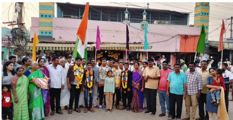
వెలుగోడు డిసెంబర్ 17 న్యూస్

పోటీల్లో మెరిసిన లిటిల్ ఏంజెల్ విద్యార్థుల .