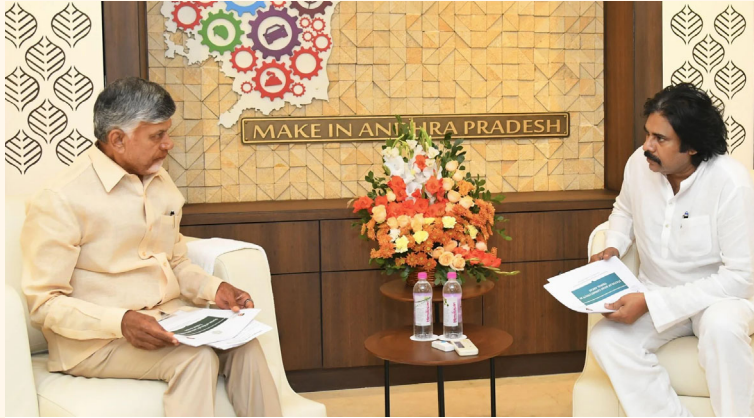
సాగునీటి సంఘాల అన్నికల్లో కూటమి ఘనవిజయం అంశం కూడా చంద్రబాబు, పవన్ మధ్య చర్చకు వచ్చింది. రాజీయే సమాకార సంఘాల అన్నికల్లో కూడా ఇదే విధంగా సమన్వయంతో ముందుకెళ్లాలని తీర్మానించారు.

నేడు పోలవరం ప్రాజెక్టును సందర్శించిన చంద్రబాబు పోలవరం నుంచి చంద్రబాబు రాగానే వెళ్లి కలిసిన పవన్ సచివాలయంలో దాదాపు 40 నిమిషాల పాటు సమావేశం ఏపీ సీఎం చంద్రబాబుతో డిప్యూటీ సీఎం పవన్ కల్యాణ్ సచివాలయంలో భేటీ అయ్యారు. ఇవాళ చంద్రబాబు పోలవరం పర్యటన ముగించుకుని రాగానే, ఆయనను పవన్ వెళ్లి కలిశారు. చంద్రబాబు, పవన్ మధ్య సమావేశం దాదాపు 40 నిమిషాల పాటు సాగింది. తన సోదరుడు నాగబాబుకు మంత్రి పదవిని ఇవ్వడంపై పవన్... సీఎం చంద్రబాబుకు ధన్యవాదాలు తెలిపినట్లు తెలుస్తోంది. నాగబాబు ప్రమాణస్వీకారం అంశంపైనా చర్చించినట్లు సమాచారం. అంతేకాకుండా, కూటమి పార్టీల మధ్య కిందిస్థాయి నేతల వరకు సమన్వయం కోసం చేపట్టాల్సిన చర్యలపై చర్చించారు. తాజా రాజకీయ పరిణామాలు, మిగిలిన నామినేటివ్ పదవులకు తుది జాబితా రూపకల్పన, ఇతర అంశాలపైనా ఇరువురు నేతలు చర్చించారు. అంతేకాదు,