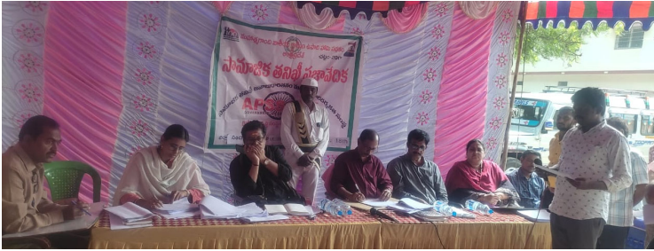
వెలుగోడు డిసెంబర్ 13 రిపబ్లిక్ స్టూన్స్