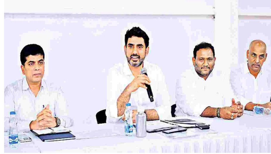
ఎస్సీ, ఎస్టీ కాలనీల్లో ప్రాథమిక పాఠశాలలపై మరింత శ్రద్ధ అవసరమన్నారు. రాష్ట్రంలో 20 కంటే తక్కువ మంది విద్యార్థులున్న బడులు 30 శాతం ఉన్నాయని, 300 పాఠశాలల్లో జీరో అడ్మిషన్లు వచ్చాయని తెలిపారు. యువగళం

ప్రభుత్వ పాఠశాలల్లో మెరుగైన ఫలితాలు సాధించడం లక్ష్యంగా సంస్కరణలు అమలుకావాలని మానవ వనరుల అభివృద్ధి శాఖ మంత్రి నారా లోకేష్ అన్నారు. సంస్కరణలు ఇప్పుడు అమలుచేయలేకపోతే రాబోయే పదేళ్లలో విద్యావ్యవస్థ మనుగడ ప్రశ్నార్థకంగా మారే ప్రమాదం ఉందన్నారు. శుక్రవారం ఉండవల్లిలోని నివాసంలో ఉపాధ్యాయ సంఘాలతో ఆయన మొదటి సమావేశం నిర్వహించారు. పాఠశాల విద్యలోనే అనేక అంశాలపై దాదాపు నాలుగు గంటలపాటు వారితో చర్చించారు. ఈ సందర్భంగా మంత్రి మాట్లాడుతూ... గత ప్రభుత్వంలో ఉన్నట్టుగా తమకు ఎలాంటి పరదాలు ఉండవని, సీఎం నుంచి ఎమ్మెల్యే వరకూ అందరూ అందుబాటులో ఉంటారని తెలిపారు. సంస్కరణల అమలులో ఎక్కడైనా పొరపాట్లు జరిగితే వాటిని వెనక్కి తీసుకుంటామని పేర్కొన్నారు. అపారే ఐడీల రూపకల్పనలో ఇబ్బందులు తలెత్తితే పరిష్కరించామని చెప్పారు. ప్రభుత్వ బడుల్లో చదివే విద్యార్థుల సంఖ్య ఏటా తగ్గుతూ వస్తోందని, డ్రాపౌట్లు కూడా పెరుగుతున్నారని ఈ నేపథ్యంలో సంస్కరణలు అమలుచేయక తప్పదని స్పష్టం చేశారు. ఫలితాల విషయంలో ప్రైవేటు పాఠశాలలో పోటీపడాలని నిర్దేశించారు.