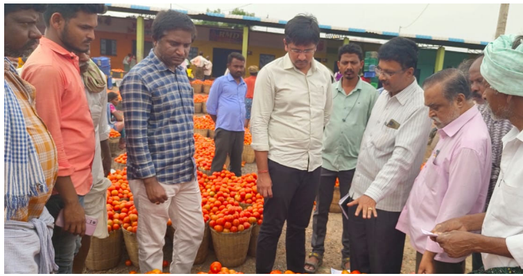
కర్నూలు, డిసెంబర్ 13(0పబ్లిక్ న్యూస్):

పత్తికొండ టమోటా మార్కెట్ లో రైతుల నుండి టమోటా కొనుగోలుకు చర్యలు తీసుకుంటున్నట్లు జాయింట్ కలెక్టర్ డా.బి.నవ్య ప్రకటనలో తెలిపారు. శుక్రవారం నాడు పత్తికొండ వ్యవసాయ మార్కెట్ యార్డుకు 42 ఉత్పత్తులు వచ్చాయని, ఇందులో 13 టన్నులు వ్యవసాయ మార్కెటింగ్ శాఖ కొనుగోలు చేసి మిిపట్టుం, గుంటూరు, కర్నూల్లోని ఏపి నగర్, కొత్తపేట, సి క్యాంపు రైతు బజార్లకు పంపిణీ చేయడం జరిగిందని జాయింట్ కలెక్టర్ తెలిపారు. ఇంతవరకు 34 టన్నుల టమోటాను రాష్ట్రంలోని వివిధ రైతుబజార్లకు పంపిణీ చేశామన్నారు. పత్తికొండ టమోటా మార్కెట్ టమోటా కిలో రూ. 4/- లకు కొనుగోలు చేయాలని వ్యాపారులకు ఆదేశాలు జారీ చేశామని జాయింట్ కలెక్టర్ తెలిపారు. ఆ మేరకు చర్యలు తీసుకుంటున్నామని జాయింట్ కలెక్టర్ వివరించారు..