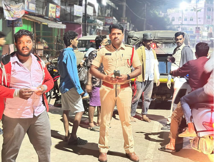
నిబంధనలు ఉల్లంఘించిన వారిపై తీసుకున్న చర్యలు

మార్దల నియంత్రణలో భాగంగా కొనసాగుతోన్న “ ఫేస్ వాష్ అండ్ గో “ కార్యక్రమం కట్టుదిట్టంగా నిర్వహిస్తున్న రాత్రి పహారాలు