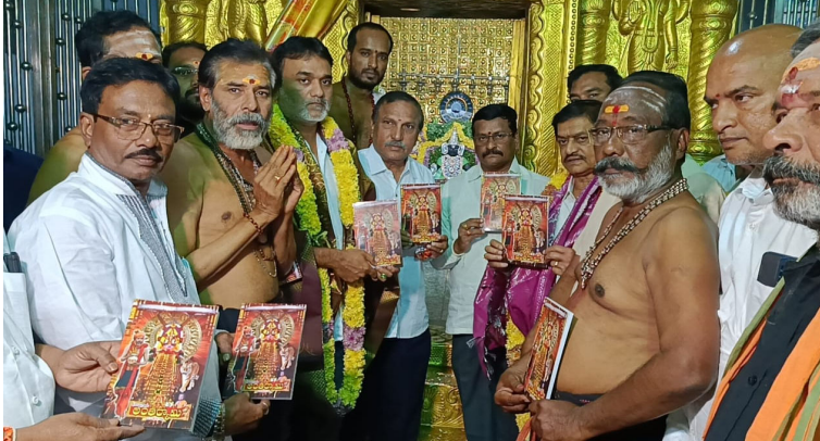
తెలుగు గంగ జలాశయంలో 7 లక్షల 50వేల చేప పిల్లల విడుదల.