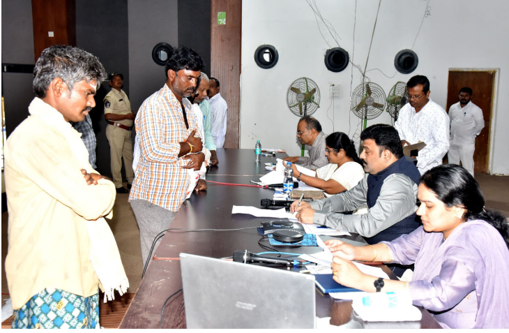
కర్నూల్ డిసెంబర్ 9 (0వార్షిక స్మారక):