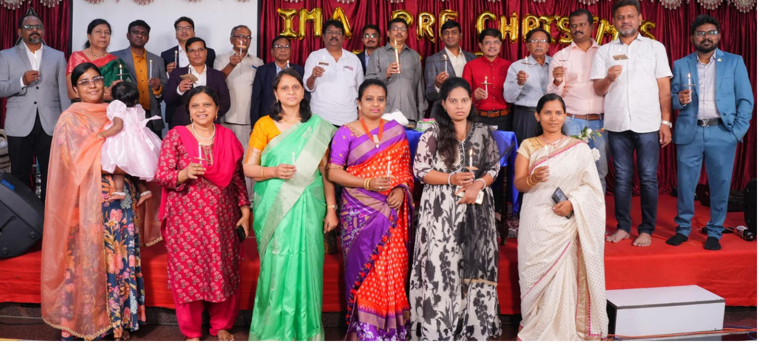
సంద్యాల డిసెంబర్ 9