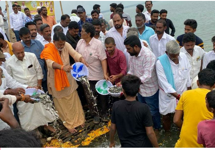
-తెలుగు గంగ జలాశయంలో