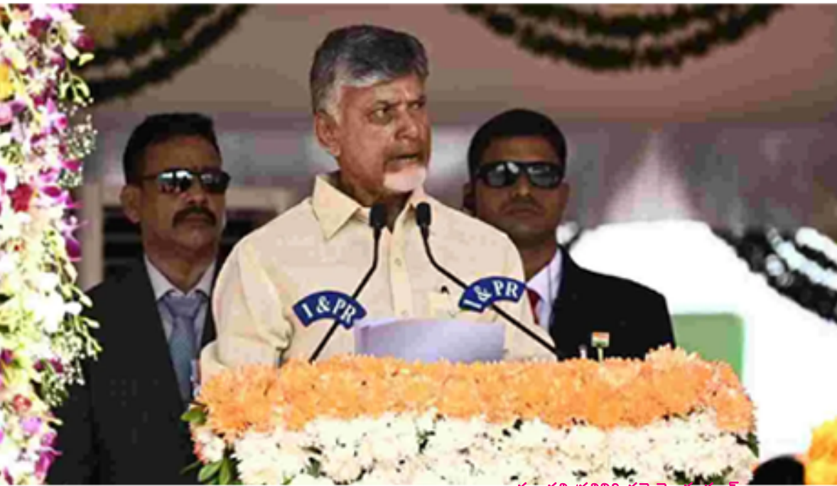
అమరావతి ప్రతినిధి పల్లె వెలుగు న్యూస్

పారిశ్రామిక రంగం అభివృద్ధికి ఏపీ సర్కారు నూతన పాలసీలు 2047 నాటికి ఏపీ నెంబర్ వన్ గా ఉండాలన్న చంద్రబాబు అందుకే ఈ పాలసీలు తీసుకువచ్చామని వెల్లడి