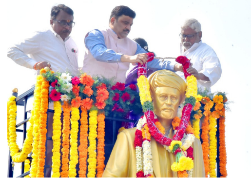
సమాజంలో సగభాగంగా ఉన్న స్త్రీలు అభివృద్ధి చెందకపోతే సమాజం అభివృద్ధి చెందదని పూలే భావించి, 1848