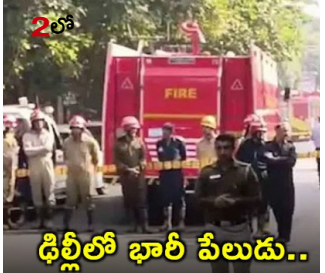
శ్రీలీలో భారీ పేలుడు..

ప్రశాంత్ విహారిలోని పీవీఆర్ మల్టీప్లెక్స్ సమీపంలోని ఓ స్వీట్ షాప్ లో ఘటన కుంభాకారము 11:48 గంటల సమయంలో స్వీట్ షాప్ వద్ద పేలుడు ఘటనాస్థలంలో తెల్లటి పొడి లాంటి పదార్థం దొరికినట్లు పోలీసుల వెల్లడి