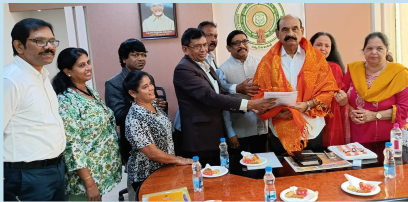
అమరావతి నవంబర్ (రిపబ్లిక్ న్యూస్):

- రాష్ట్ర మైనార్టీ సంక్షేమ న్యాయశాఖ మంత్రి ఎన్.ఎం.డి. ఫరూక్ మంత్రి ఫరూక్ ను కలిసిన ఏడు రాష్ట్రాల ప్రతినిధుల బృందం 2లో