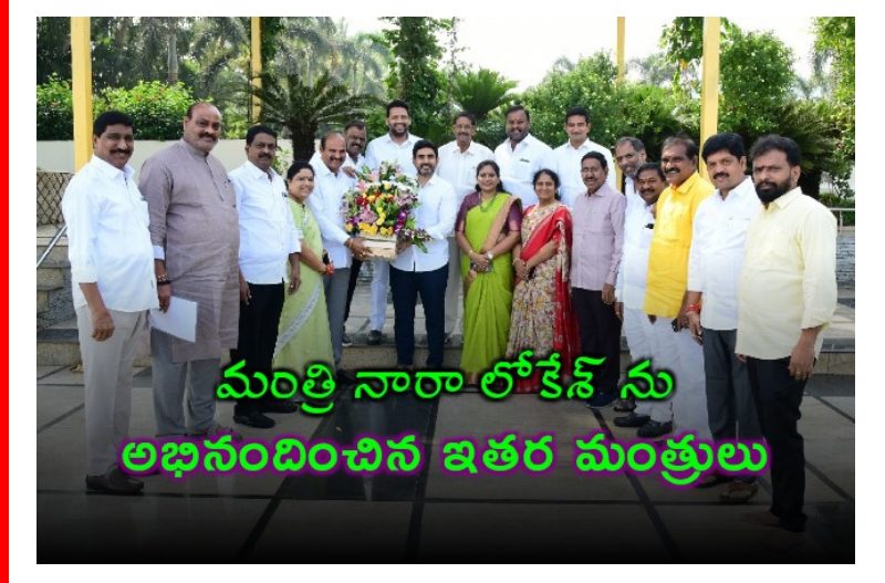
మంత్రి నారా లోకేశ్ ను అభినందించిన ఇతర మంత్రులు