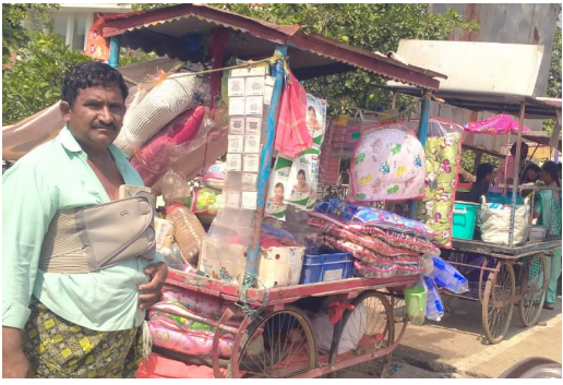
ఎంపీ డాక్టర్ బైరెడ్డి శబరికి ధన్యవాదములు తెలిపిన చిరు వ్యాపారులు

నంద్యాల ప్రతినిధి, నవంబర్ 06, (రిపబ్లిక్ న్యూస్): నంద్యాల జిల్లా ప్రభుత్వ ఆసుపత్రి ముందు రోడ్డును, ఆసుపత్రి రోగులను నమ్ముకొని జీవిస్తున్న 27 కుటుంబాల చిరు వ్యాపారుల కళ్ళలో నంద్యాల ఎంపీ డాక్టర్ బైరెడ్డి శబరి ఆనందం నింపారు. నంద్యాల ప్రభుత్వ ఆసుపత్రి ముందు రోడ్డు పుల్ ఫాత్ ను ఆగ్రహించి ప్రయాణికులకు, ఆసుపత్రి రోగులకు అటంకం కలిగిస్తున్నారని ట్రాఫిక్ పోలీసులు, మున్సిపల్ అధికారులు చిరు వ్యాపారుల తాత్కాలిక రేకుల