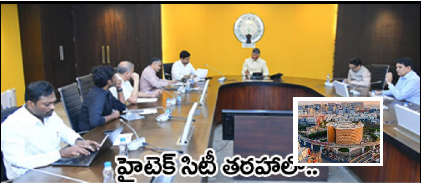
హైటెక్ సిటీ తరహాలో...

ఎడిటర్ : నాగేంద్ర వేజేలు : 4 సంపుటి : 1 - సంచిక 227 ఆంధ్ర ప్రదేశ్ , తెలంగాణ బుధవారం 27-11-2024 మేల-6