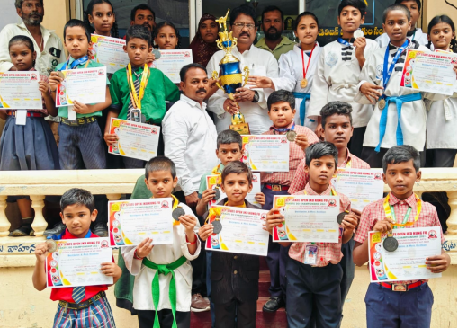
12 స్వర్ణ, 12 రజత, 15 కాంస్య పతకాలు.