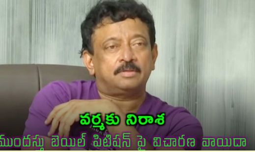
ముందస్తు బెయిల్ పిటిషన్ పై విచారణ వాయిదా

వర్త అజ్ఞాతంలో ఉన్నప్పటికీ ఆయన ట్విట్టర్ హ్యాండిల్ మాత్రం యాక్టివ్ గా ఉంది. 23న కోయంబత్తూరులో హైకోర్ట్ లో పాల్గొన్నట్లు నటులతో దిగిన ఫోటోలను వర్త షేర్ చేశారు