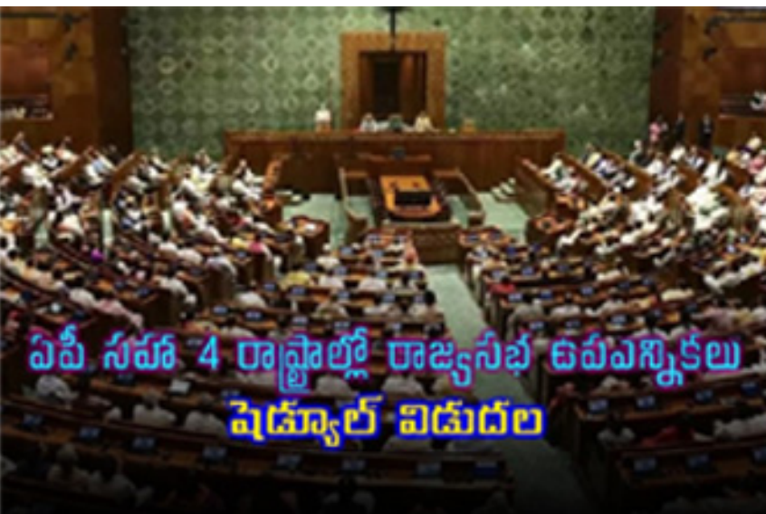
ఏపీ సహా 4 రాష్ట్రాల్లో రాజ్యసభ ఉప ఎన్నికలు షెడ్యూల్ విడుదల

ఏపీలో మూడు రాజ్యసభ స్థానాలు ఖాళీ మరో మూడు రాష్ట్రాల్లో మూడు ఖాళీలు మొత్తం 6 రాజ్యసభ ఖాళీలకు డిసెంబరు 20న పోలింగ్ అదే రోజున ఓట్ల లెక్కింపు