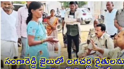
సంగారెడ్డి జైలులో లగచర్ల రైతులను విచారించిన ఎన్ హెచ్ఆర్ సి

విశాఖలో రైల్వే జోన్ కార్యాలయం కోసం టెండర్ల ఆహ్వానం డిసెంబర్ 27లోగా టెండర్లు దాఖలు చేయాలన్న రైల్వే శాఖ టెండర్ల దక్కించుకున్నవారు చంద్రేష్ భవన్ నిర్మాణాన్ని పూర్తి చేయాలని సూచన మొత్తం 11 అంతస్తుల్లో భవన నిర్మాణం ఈ కార్యాలయం నిర్మాణానికి రూ. 149.16 కోట్ల వ్యయం