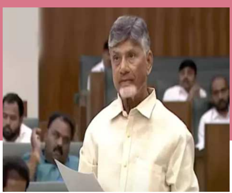
ఇకపై భూ కబ్జాలకు పాల్పడితే జైలుకే..