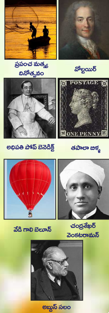
ప్రపంచ మత్స్య దినోత్సవం