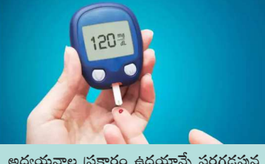
బ్లడ్ షుగర్ లెవల్స్..