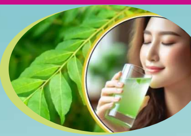
బ్లడ్ షుగర్ లెవల్స్..

కరివేపాకు మన బాడీని డీటాక్సిఫై చేసినట్లుగానే మన లివర్ కు కూడా కాపాడుతుంది. ఇందులోని గొప్ప గుణాలు లివర్ ని డీటాక్సిఫై చేసి కారెయిన్స్ కాపాడతాయి. అదే విధంగా, కరివేపాకులోని యాంటీ ఇన్ ఫ్లమేటరీ గుణాలు బాడీ ఇన్ ఫ్లమేషన్ ని తగ్గిస్తుంది. దీని వల్ల మంట, వాపు వంటి సమస్యలు తగ్గతాయి.