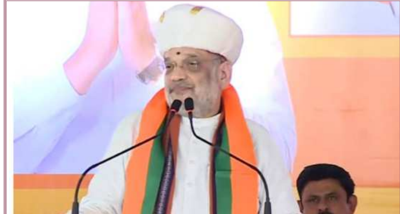
'మీ కాళ్లపై మీరు నిల్చినదం నేర్చుకోండి'.. అజిత్ పవార్ వర్షానికి సుప్రీం చురక

ప్రదర్శించే రాజ్యాంగ ప్రతి అసలైంది కాదని.. అది నకిలీదన్నారు. కొందరు పాత్రికేయులు దాన్ని చూడగా.. అందులో భాగీ పేజీలే ఉన్నాయన్నారు. నకిలీ ప్రతిని చూపించి ప్రజల నమ్మకాన్ని పంపిణీ చేయడం ద్వారా బాబా సాహెబ్ అంబేద్కర్ను అపమనించారని ధ్వజమెత్తారు. గత యూపీఏ పాలనలో ఓటు బ్యాంకు రాజకీయాలతో దేశంలో నక్సలిజం, ఉగ్రవాదం సమస్యలపై ఎలాంటి చర్యలు తీసుకోలేదని మండిపడ్డారు. కాంగ్రెస్ రాజకీయమంతా మోసంతోనే నడుస్తుందని.. మహారాష్ట్రలో 'మహాయుతి' ప్రభుత్వం వచ్చాక పెట్టుబడులు తగ్గిపోయాయని ప్రచారం చేస్తున్నారన్నారు. కానీ, ఏకాగ్ర శిందే సారథ్యంలో 'మహాయుతి' పాలనలో విదేశీ ప్రత్యక్ష పెట్టుబడుల్లో మహారాష్ట్ర సంబంధాన్ని నిలిపివేసింది తెలిపారు. శరద్ పవార్ను టార్గెట్ చేస్తూ.. ఆయన సీఎంగా, కేంద్రమంత్రిగా ఎన్నో సందర్భాలుగా పనిచేసినా మరలా భాషకు ప్రాచీన హోదా కల్పించేందుకు కృషిచేయలేదని విమర్శించారు.