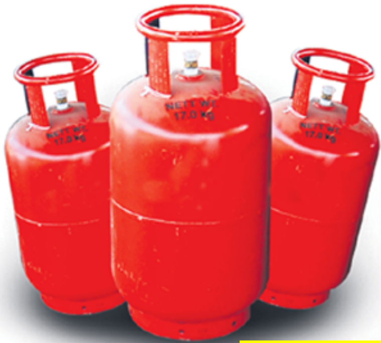
అమరావతి: అక్టోబర్ 21 (రెవల్వ్యూక్ న్యూస్)

ఉచితంగా మూడు గ్యాస్ సిలిండర్లు ఇస్తామని ఎన్నికల్లో హామీ