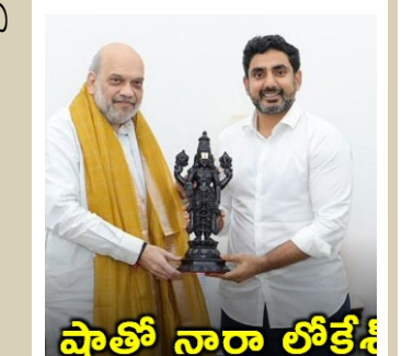
షాతో నారా లోకేశ్