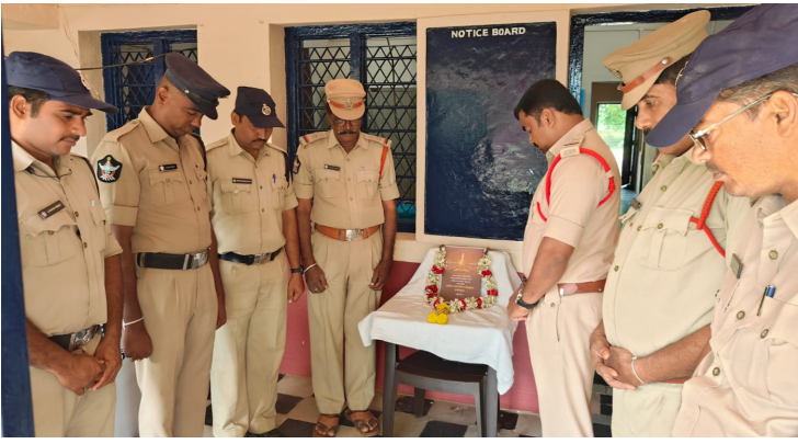
అమరులైన పోలీసులకు ఘన నివాళి అర్పించారు.