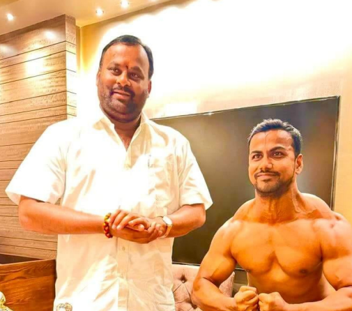
పవర్ లిఫ్టింగ్ లో 65 కేజీల విభాగంలో మొత్తం 380 కేజీ లిఫ్ట్ చేసి బాగారు పతకాన్ని, 65 కేజీల విభాగంలో రెండవ స్థానంలో నిలిచి సిల్వర్ మెడల్ సాధించడం జరిగింది.

చేరుకున్నాయన్నారు. దశావతారాలలో ఆఖరుగా శనివారంనాడు విజయ దశమి సందర్భంగా జగన్మాత కనకదుర్గమ్మ శ్రీరాజరాజేశ్వరి దేవిగా భక్తులకు దర్శనమిస్తుందన్నారు. ఈ కార్యక్రమంలో సంద్యాల పుర ప్రముఖులు, బేద బుడగ జంగాల పెద్దలు మహిళలు అధిక సంఖ్యలో పాల్గొన్నారు.