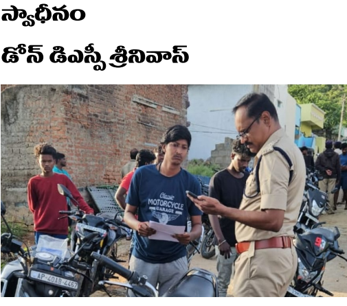
సంద్యాల 11, అక్టోబర్ 11 (రిపబ్లిక్ న్యూస్): నేర నివారణ, శాంతిభద్రతల పరిరక్షణే లక్ష్యంగా జిల్లా పోలీసులు ప్రత్యేక దృష్టి సారించారు. ఈ సందర్భంగా నేర

డోన్ టాన్ ఫోలీసు స్టేషన్ పరిధిలో కార్టన్ సెర్స్ ఆపరేషన్ అసాంఘిక, సంఘ విద్రోహశక్తుల ఆట కట్టించి నేర రహిత జిల్లాగా తీర్చిదిద్దడమే లక్ష్యం రౌడీషీటర్లు, అనుమానిత ప్రాంతాలు, అనుమానస్పద వ్యక్తుల ఇళ్ళల్లో విస్తృతంగా దాడులు ధ్వంస పత్రాలు లేని 40 ద్విచక్రవాహనాలు, 03 కార్లు