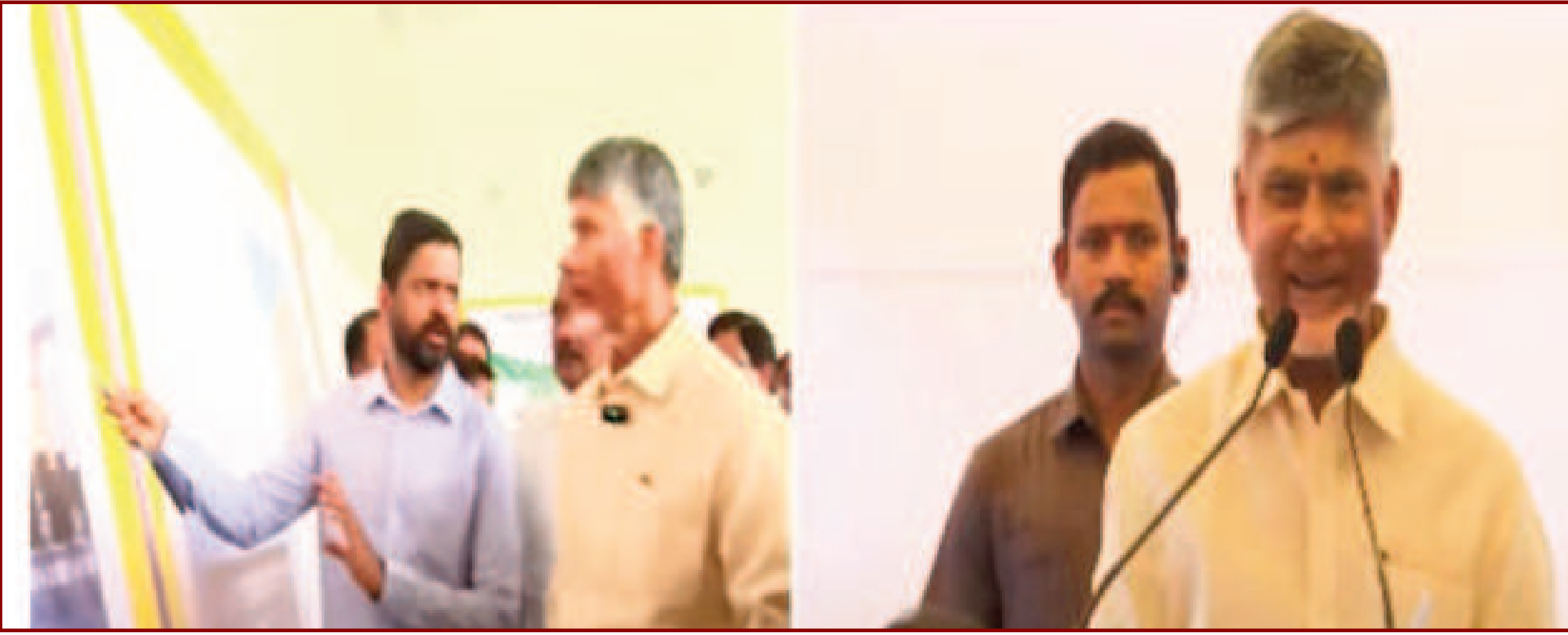
అమరావతి, అక్టోబర్ 19 (ఆపజెక్ న్యూస్):

సీఆర్డీపీ ఆఫీసు పనులను ప్రారంభించి. ఈ కార్యక్రమాన్ని మొదలుపెట్టారు.