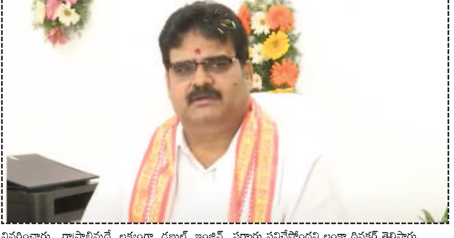
వివరించారు. రాష్ట్రాభివృద్ధి అక్కంగా దబల్ ఇంజనీ సర్కారు పనిచేస్తోందని లంకా దినకర్ తెలిపారు.

విజయవాడ, అక్టోబర్ 19 (రిపబ్లిక్ న్యూస్) : గత ఐదేళ్లలో వైకాపా హయాంలో కేంద్ర నిధులు పక్కదారి పట్టించారని భాజపా నేతలంకా దినకర్ విమర్శించారు. 20 సూత్రాల అమలు కమిటీ వైర్లన్ గా బాధ్యతలు స్వీకరించిన అనంతరం ఆయన మాట్లాడారు. స్వర్ణాంధ్ర సాధనకు అందరం కలిసి కృషి చేస్తామన్నారు. 20 సూత్రాలు అందరికీ తెలిసేలా అన్ని కలెక్టరేట్ల వద్ద ఉంచుతామని చెప్పారు. కేంద్ర ప్రభుత్వం అన్ని రకాలుగా రాష్ట్రానికి సహకారం అందిస్తోందని పేర్కొన్నారు. సీఎం చంద్రబాబు వెంట తామంతా సదుస్థామని చెప్పారు. అర్హతైన అందరికీ పథకాలు అందించేందుకు సీఎం కృషి చేస్తున్నారని