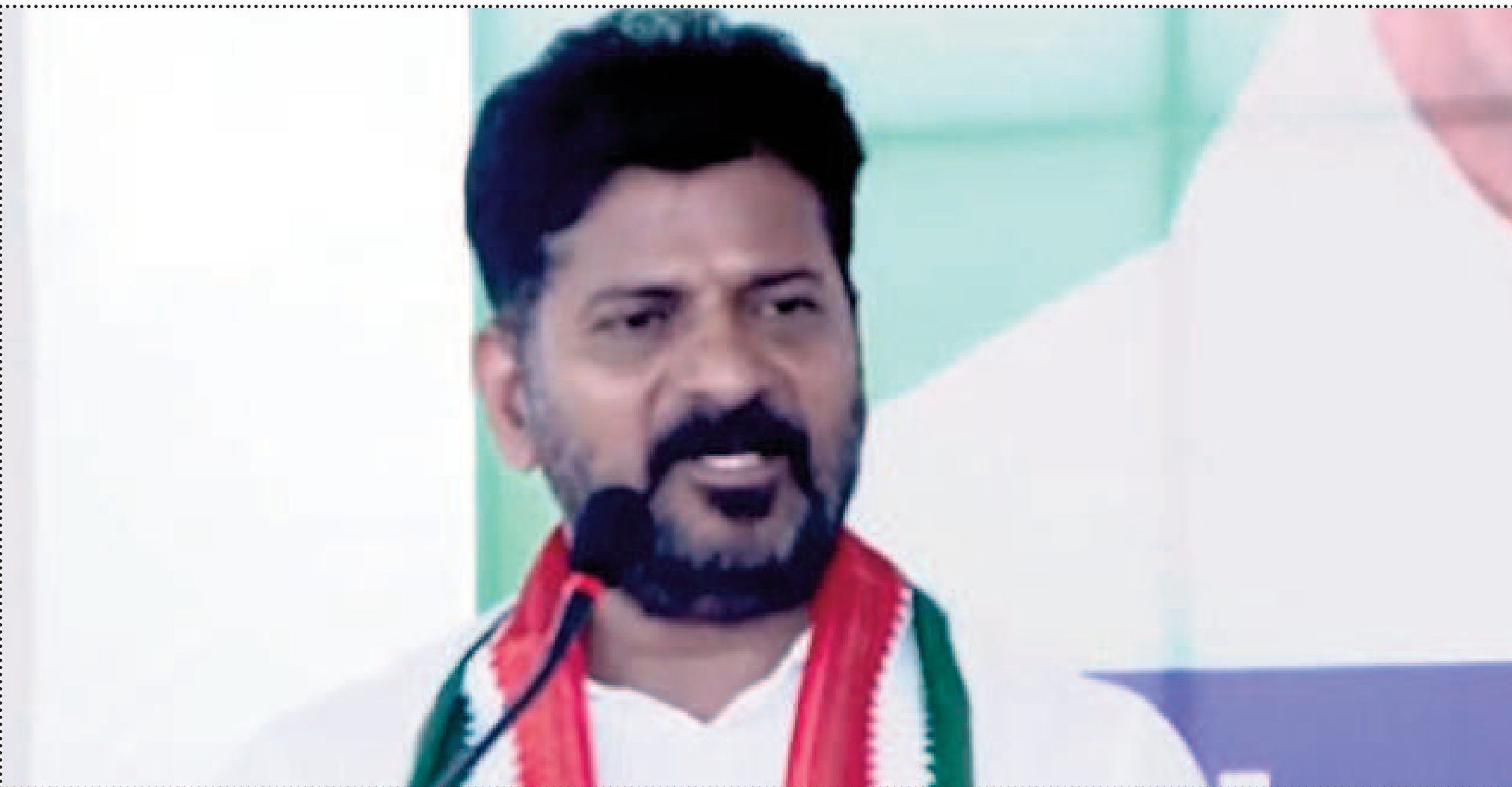
హైదరాబాద్, అక్టోబర్ 19 (ఆపజెక్ న్యూస్):

నాలాలు, చెరువులను ఆక్రమించుకున్న వారే హైద్రాబాద్ మాసి భయపడుతున్నారని తెలంగాణ సీఎం రేవంత్తెడ్డి అన్నారు.