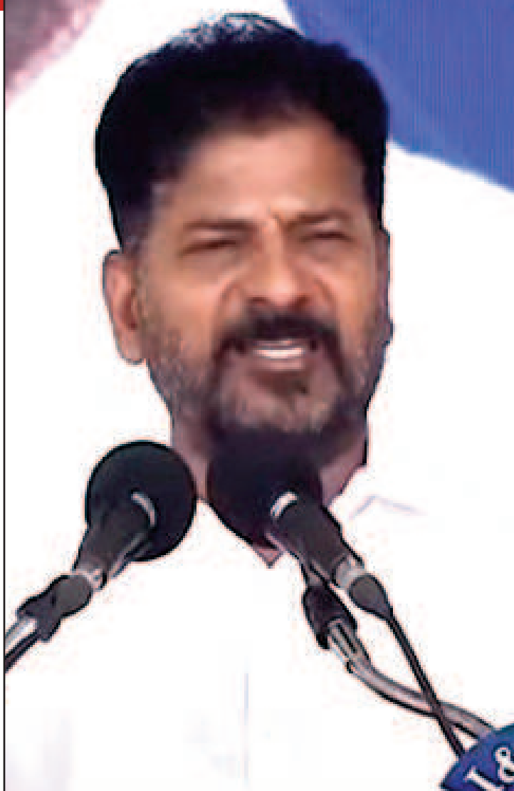
దోచుకున్న సొమ్ము నుంచి రూ.500 కోట్లు ఇవ్వండి

సంక్షేమ పథకాలు అందరికీ అందుబాటులోకి తీసుకురావాలనే ఉద్దేశంతోనే వ్యామిలి డిజిటల్ కార్డు ఇవ్వాలని నిర్ణయించామని తెలంగాణ సీఎం రేవంత్ రెడ్డి అన్నారు. హైదరాబాద్, (0పబ్లిక్ స్కూల్స్), అక్టోబర్ 3: సంక్షేమ పథకాల అందరికీ అందుబాటులోకి తీసుకురావాలనే ఉద్దేశంతోనే వ్యామిలి డిజిటల్ కార్డు ఇవ్వాలని నిర్ణయించామని తెలంగాణ సీఎం రేవంత్ రెడ్డి అన్నారు. కుటుంబ సంక్షేమ పథకాల అందరికీ అందుబాటులోకి తీసుకురావాలనే ఉద్దేశంతోనే వ్యామిలి డిజిటల్ కార్డు ఇవ్వాలని నిర్ణయించామని తెలంగాణ సీఎం రేవంత్ రెడ్డి అన్నారు. "మూసీని అడ్డంపెట్టుకుని ఎంతకాలం కార్యాలయాల చుట్టూ చెప్పులు అరిగేలా తిరిగారన్నారు. ఇటుకాకారు.. హైదరాబాద్ లో మీ భరతం పడతాం" అని సికింద్రాబాద్ లోని కంటోన్మెంట్లో కుటుంబ డిజిటల్ కార్డుల భారానను ఉద్దేశించి సీఎం వ్యాఖ్యానించారు. ప్రారంభోత్సవ కార్యక్రమంలో ఆయన మాట్లాడారు. ఈ విచక్షణ కోల్పోయి మాట్లాడుతున్నారు అధికారం కోల్పోవడంతో విచక్షణ కోల్పోయి మాట్లాడుతున్నారని పరోక్షంగా కేటీఆర్, హరిశ్రీధరు ఉద్దేశించి సీఎం అన్నారు. "నిరుద్యోగుల ఉపసంహరణ పోషకున్నారు.. అందుకే మీ ఉద్యోగం వారు తీశారు. అధికారంలోకి వచ్చిన 90 రోజుల్లో 30 వేలమందికి ఉద్యోగాలు ఇచ్చారు. దీనినిబట్టి మరో 30వేలకు పైగా ఇవ్వాలని నిర్ణయించాం. టీచర్ల నియామకాలు గమనిస్తోంది.