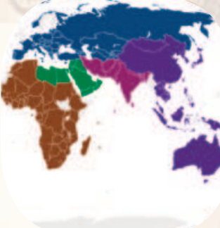
ప్రపంచ పర్యాటక దినోత్సవం