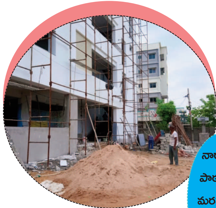
నారాయణ పాఠశాలలో మరమ్మత్తులు చేస్తున్న చిత్రాలు

అధికార పార్టీ అండదండ ఉంటే చాలు ఏమి చేసిన అధికారులు నిమ్మకు నిరెత్తినట్లు వ్యవహరిస్తారని మరోసారి జిల్లాలో నిరూపితమయ్యింది. రాష్ట్రంలో ఇప్పటికే ఇరుకు గదులలో విద్యార్థులను కుక్కతూ లక్షల రూపాయల అక్రమ ఫీజులను వసూలు చేస్తూ ర్యాంకుల వేటలో నిబంధనలను తుంగలో తొక్కతారని నారాయణ విద్యార్థులకు అపవాదు ఉంది.