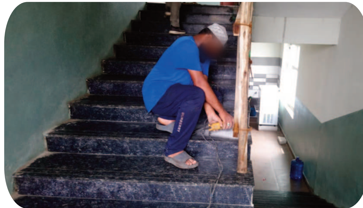
నంద్యాల అర్డర్, సెప్టెంబర్ 26 (రిపబ్లిక్ న్యూస్) రవికుమార్

దీనికి ఉదాహరణగా పట్టణంలో సాయిబాబానగర్లో నిర్మాణంలో ఉన్న భవనంను నారాయణ విద్యార్థులు లీజుకు తీసుకున్నారు. కానీ ఈ భవన నిర్మాణం పూర్తి అయ్యేంత వరకు కూడా నారాయణ విద్యార్థుల యాజమాన్యం ఓపిక పట్టలేకపోయింది. తొందరగా విద్యార్థుల ప్రాణాలను గాలికి పదిలేసింది. ఈ భవనంలో నిర్మాణం పూర్తి అవుతున్న అదుర్దాలో విద్యార్థుల ప్రాణాలను గాలికి పదిలేసింది. ఈ భవనంలో నిర్మాణం పూర్తి అవుతున్న అదుర్దాలో విద్యార్థుల ప్రాణాలను గాలికి పదిలేసింది. ఈ భవనంలో నిర్మాణం పూర్తి అవుతున్న అదుర్దాలో విద్యార్థుల ప్రాణాలను గాలికి పదిలేసింది.