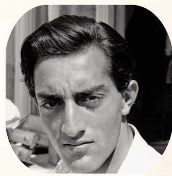
మన్మూర్ అలీ ఖాన్ పటోడి