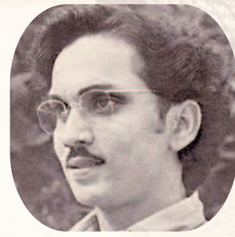
డా. అక్కినేని నాగేశ్వరరావు