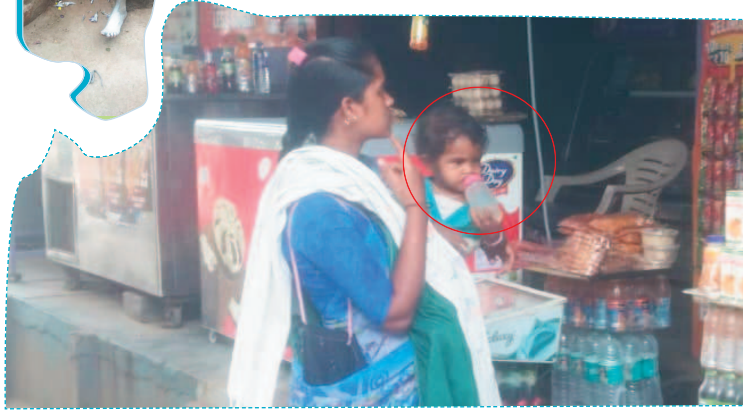
పని బద్దతో బిక్కుటాన చేస్తున్న మహిళ